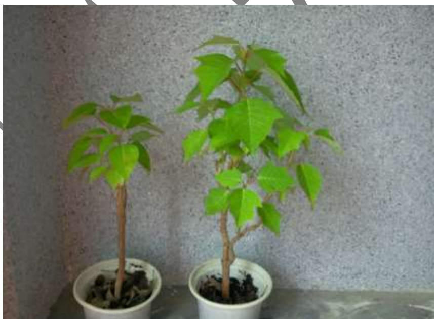
شکل ۵- اثر تیمارهای مختلف روی تعداد برگ. گیاه شاهد (چپ) و گیاه تیمارشده با ۱/۸ گرم در لیتر نانو کلات آهن بدون سایکوسل.