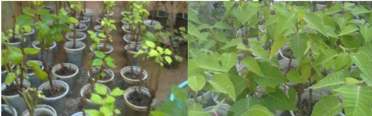
شکل ۲- کشت قلمه‌های ریشه‌دارشده بنت قنسول در بستر کاشت حاوی نسبت مساوی از کوکوپیت، کمپوست زباله شهری و خاک زراعی برای رشد و نمو. بعد از ۳ ماه (شکل سمت چپ) و بعد از ۶ ماه (شکل سمت راست).