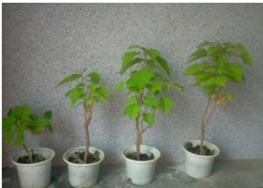
شکل ۴- اثر تیمارهای مختلف روی ارتفاع گیاه. از چپ به راست: گیاه شاهد، گیاه تیمارشده با ۰/۹ گرم در لیتر نانو کلات آهن و ۱۰۰۰ میلی گرم در لیتر سایکوسل، گیاه تیمارشده با ۱/۸ گرم در لیتر نانو کلات آهن بدون سایکوسل، و گیاه تیمارشده با ۳/۶ گرم در لیتر نانو کلات آهن بدون سایکوسل.