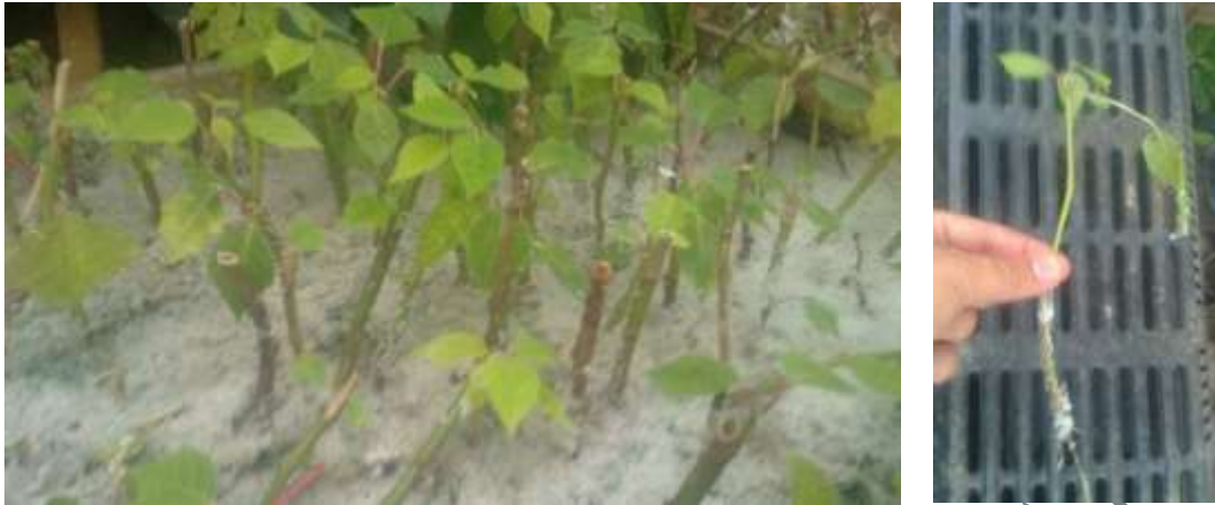
شکل ۱- قلمه‌های ساقه‌ی بنت قنسول کشت‌شده در بسترهای کاشت حاوی پرلیت (شکل سمت چپ) برای ریشه‌زایی و تصویر یک قلمه‌ی ریشه‌دارشده (شکل سمت راست).