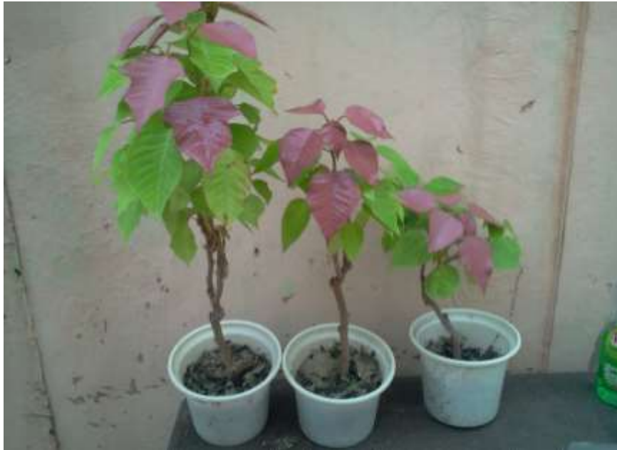
شکل ۶- اثر تیمارهای مختلف روی تعداد براکته. از راست به چپ: گیاه شاهد، گیاه تیمارشده با 0.9 \text{ mg l}^{-1} گرم در لیتر نانو کلات آهن و 500 \text{ mg l}^{-1} میلی گرم در لیتر سایکوسل، و گیاه تیمارشده با 1.8 \text{ g l}^{-1} گرم در لیتر نانو کلات آهن بدون سایکوسل.