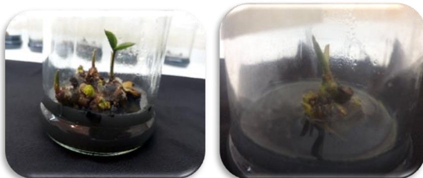
شکل ۳- باززایی شاخه از ریزوم گیاه زامیفولیا Figure 3- Regenerated shoots from rhizomes of Zamioculcas zamiifolia