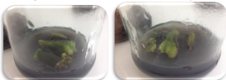
شکل ۵- کالوس ایجاد شده از شاخه گیاه زامیفولیا Figure 5- Produced callus from the shoot of Zamioculcas zamiifolia