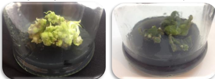
شکل ۴- کالوس ایجاد شده از برگ گیاه زامیفولیا Figure 4- Produced callus from the leaves of Zamioculcas zamiifolia