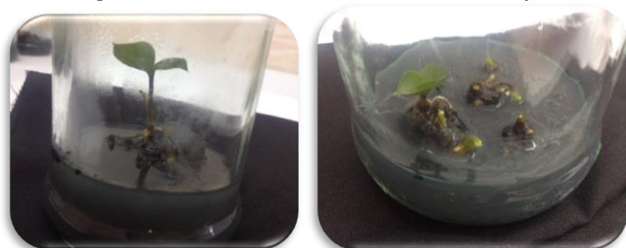
شکل ۶- باززایی از برگ گیاه زامیفولیا Figure 6- Regenerated shoots from leaves of Zamioculcas zamiifolia