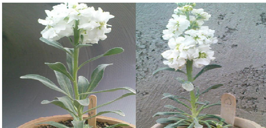
شکل ۲- اثر تیمار ۸ درصد تفاله چغندر قند (الف) و پسماند فاضلاب شهری (ب) بر طول گل آذین شب بو گل‌دانی رقم Column Crimson