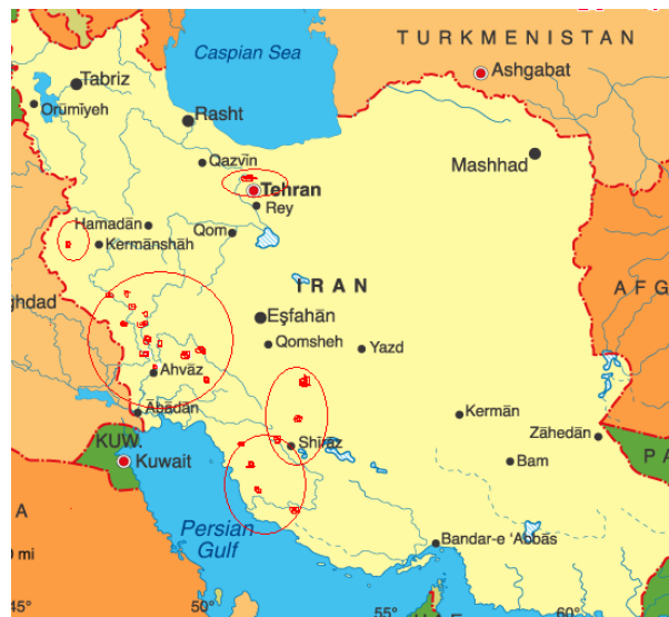
شکل (۱) پراکنش توده‌های بابونه آلمانی جمع آوری شده در این بررسی