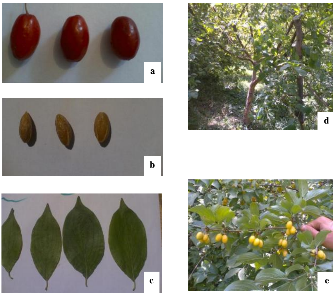
شکل ۱- تصاویری از قسمت‌های مختلف ذغال اخته. (a) میوه (b) بذر (c) برگ (d) درخت و (e) شاخ و برگ و میوه‌های نارس Figure 1- Different parts of cornelian cherry. a) Fruit, b) Seed, c) Leaf, d) Tree, and e) Foliage and unripe fruit

وزن هسته / (وزن هسته - وزن میوه) = نسبت گوشت به هسته