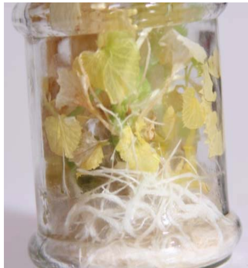
شکل ۲- القای گیاه کامل از کوتیلدون در حضور یک میلی‌گرم بر لیتر BA و NAA در ژنوتیپ طالبی اصفهان

در این آزمایش BA تنظیم‌کننده رشد ضروری برای اندام‌زایی در ریزنمونه‌های کشت‌شده طالبی بوده و غلظت ۰/۵ تا ۱ میلی‌گرم در لیتر BA غلظت مناسبی جهت القای شاخساره بود. در مطالعه حاضر عوامل ژنوتیپ، ریزنمونه و تنظیم‌کننده‌های رشد تاثیر بارزی در واکنش به اندام‌زایی در طالبی داشته‌اند. همچنین یافته حاضر دال بر این بود که با ترکیب مناسبی از محیط کشت و تنظیم‌کننده برای اندام‌زایی طالبی، تنها ژنوتیپ‌های دارای تنوع ژنتیکی زیاد از لحاظ واکنش با یکدیگر متمایز می‌شوند.