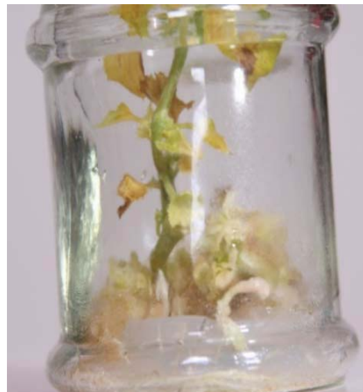
شکل ۳- القای گیاه کامل از کوتیلدون در حضور BA و NAA در ژنوتیپ گرگر