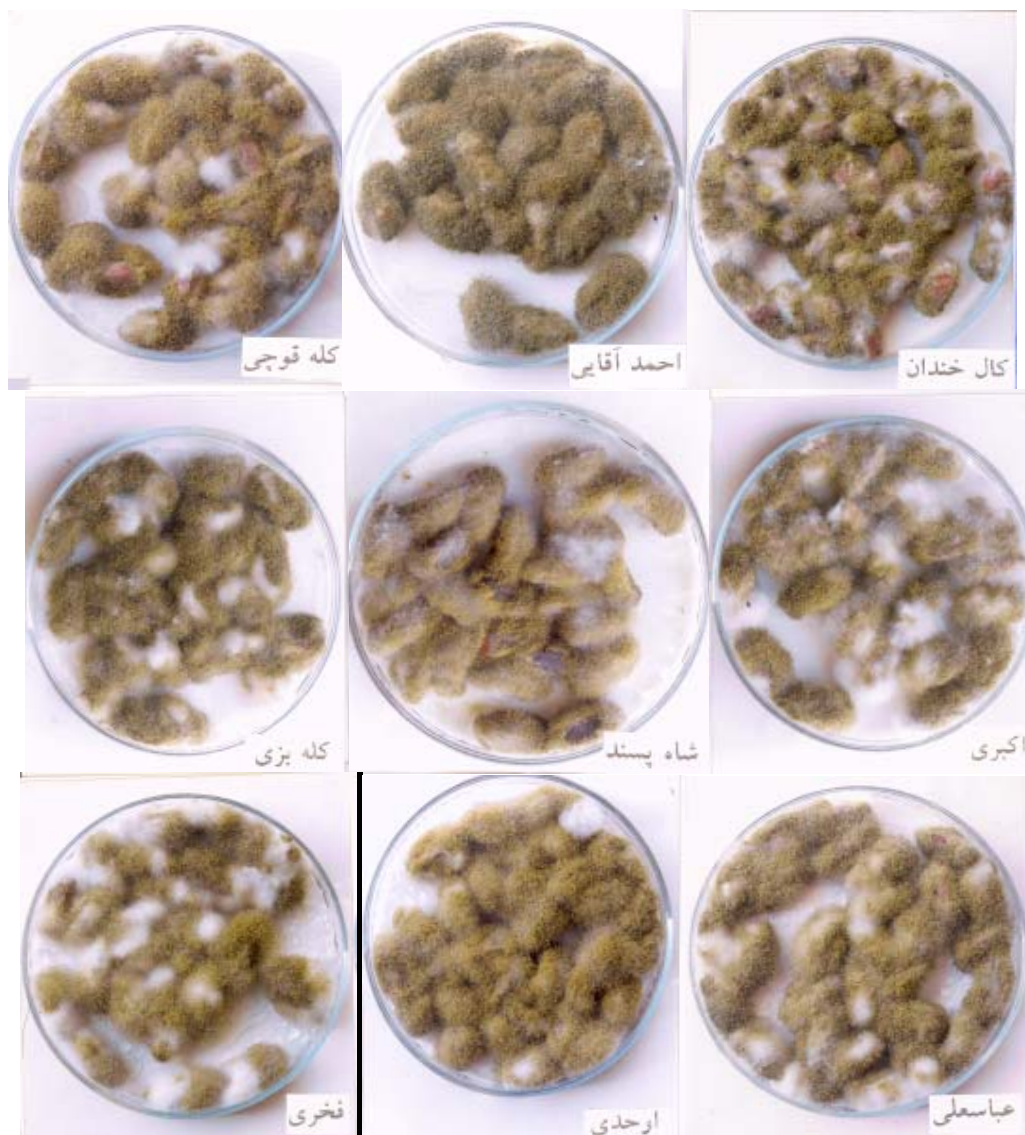
شکل ۵ - نمایی از رشد و کلونیزاسیون کامل قارچ A. flavus روی مغز زخمی ارقام مختلف پسته (۸ روز بعد از مایه زنی)