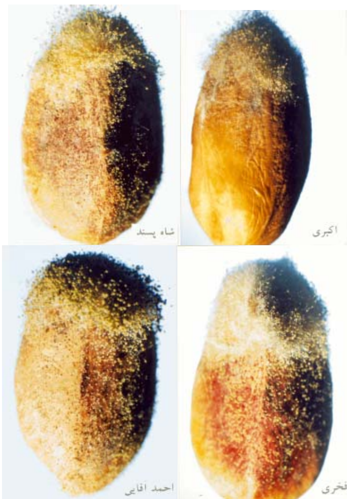
شکل ۳ - مقایسه میزان رشد قارچ A. flavus روی مغز پسته زخمی ارقام مختلف (۲/۵ روز بعد از مایه زنی)