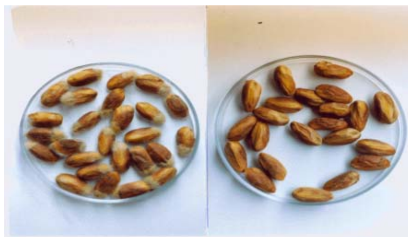
شکل ۱ - مقایسه میزان رشد قارچ A. flavus روی مغز پوسته سالم (سمت راست) و زخمی (سمت چپ) رقم اکبری (۲/۵ روز بعد از مایه زنی)