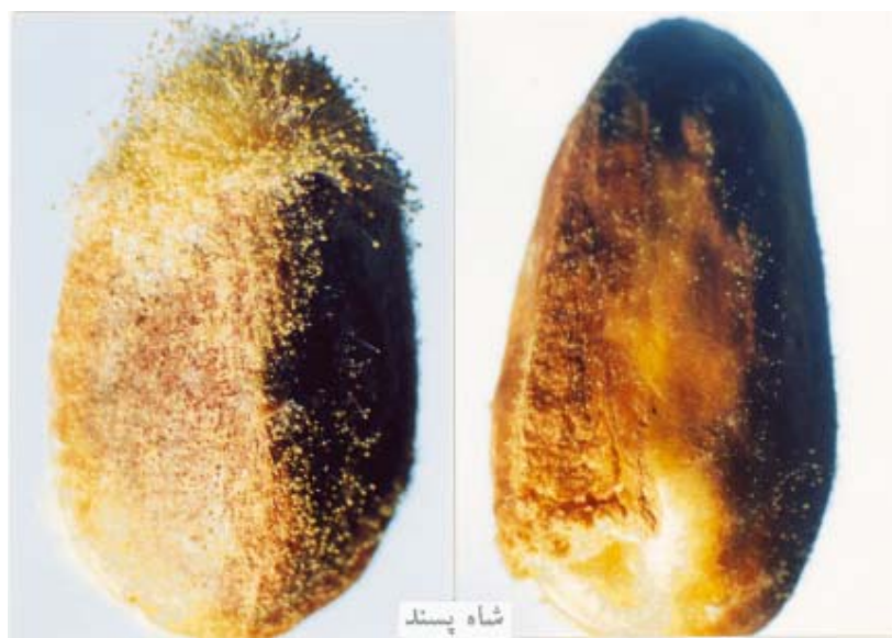
شکل ۲ - مقایسه میزان رشد قارچ A. flavus روی مغز پوسته سالم (سمت راست) و زخمی (سمت چپ) رقم شاه پسند (۲/۵ روز بعد از مایه زنی)