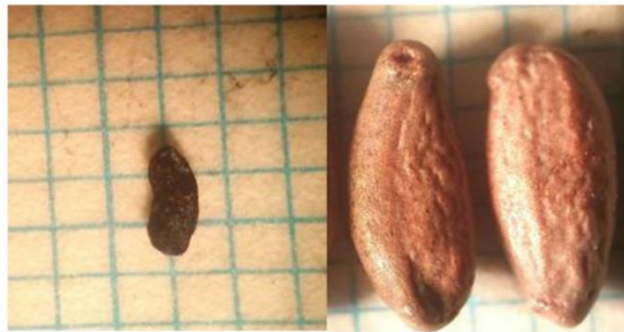
شکل ۳- بذور سالم (سمت راست) و بذر سقط‌شده (سمت چپ) در یکی از ژنوتیپ‌های زرشک مورد بررسی Figure 3- Set seeds (right) and aborted seed (left) in one of the evaluated barberry genotypes

اندازه‌گیری غیر مستقیم آن صفت استفاده کرد (Zarei et al., 2010). در این پژوهش ضرایب همبستگی بین ۱۵ صفت در ژنوتیپ‌های مورد مطالعه اندازه‌گیری شده که در جدول ۵ آورده شده است. ضرایب همبستگی ساده بین صفات نشان می‌دهد که بین برخی از صفات اندازه‌گیری شده همبستگی معنی‌داری وجود دارد. برای مثال درصد گوشت با درصد بذر همبستگی منفی بسیار معنی‌داری در سطح ۱ درصد دارد. بنابراین با کاهش تعداد بذر و به بیان دیگر با توسعه پارتوکاری در زرشک می‌توان انتظار داشت که درصد گوشت میوه‌ها افزایش یافته و کیفیت میوه بهبود یابد.